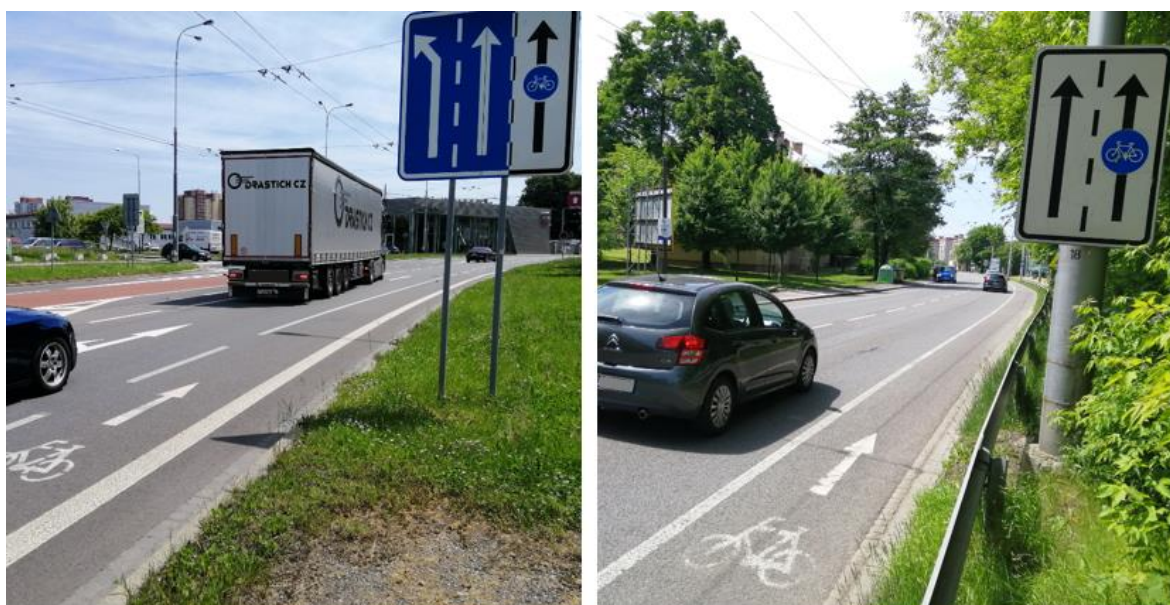
Vyhrazený jízdní pruh na ulici Hornopolní (vlevo) a ulici Novoveská (vpravo)