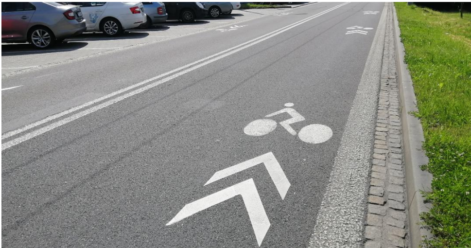
Vodorovné dopravní značení V 20 (piktogramový koridor pro cyklisty) na ul. Janáčkova v Moravské Ostravě