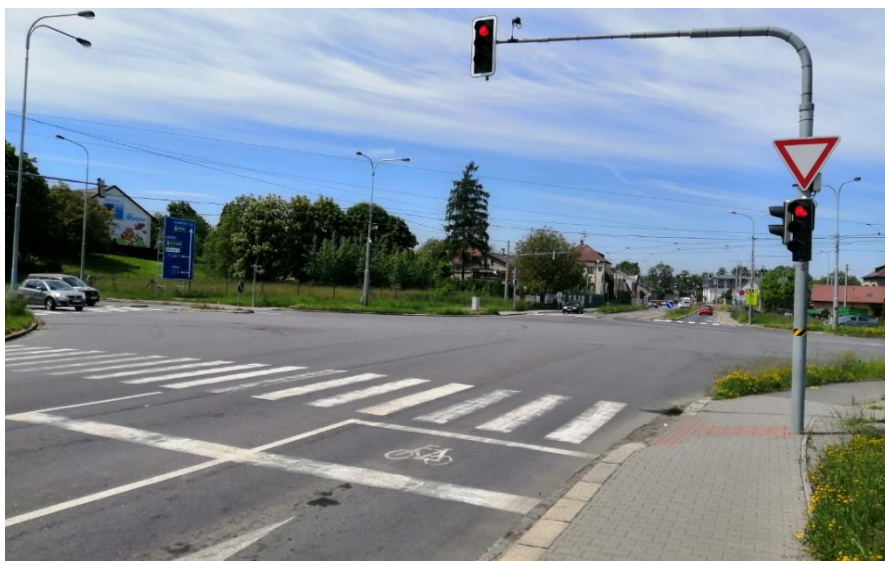
Vodorovné dopravní značení V 19 (vyhrazený prostor pro cyklisty) na ul. Vřesinská v Ostravě-Porubě

V Ostravě můžeme taková cyklistická opatření vidět např. na ulici 1. Máje v Mariánských Horách nebo v ulici Vřesinská v Ostravě-Porubě.