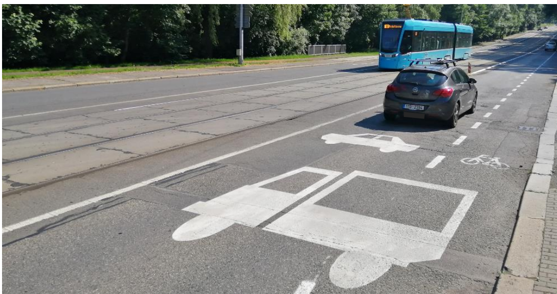
Ochranný jízdní pruh pro cyklisty na ulici 28. října

Doposud se tento typ integračního na území Ostravy nenacházel, nedávno ovšem došlo k jeho realizaci v hlavním dopravním prostoru ul. 28. října v úseku od tzv. křižovatky u Vodárny až po Dům energetiky. Pro lepší pochopení a větší přehlednost je navíc doplněn o symbol nákladního a osobního vozidla.